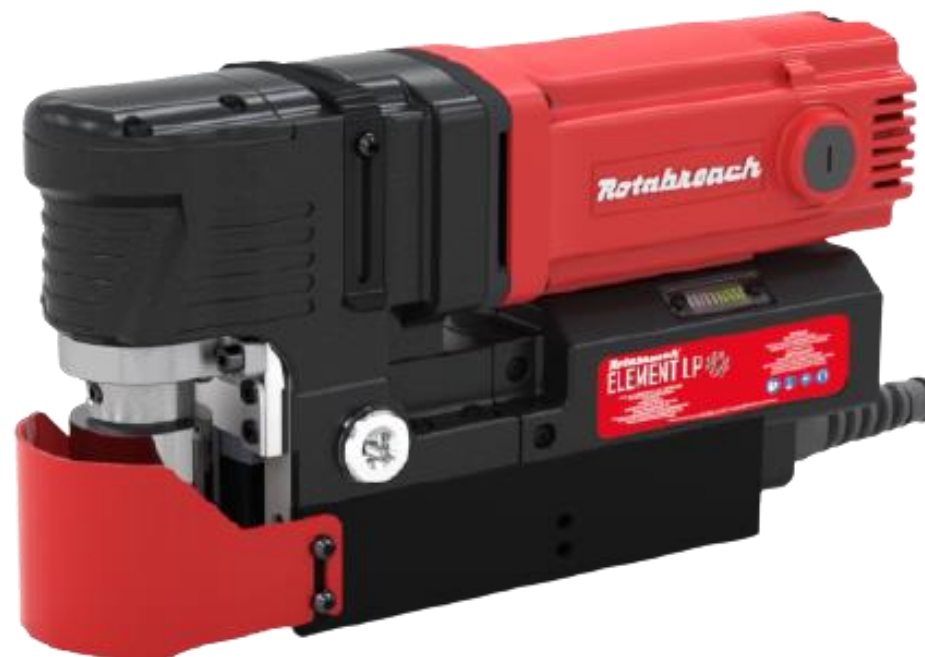
Element 50 Low Profile

قدرت موتور: ۱۲۰۰ وات مته گردبر: قطر ۵۰ میلی‌متر عمق سوراخکاری: ۵۰ میلی‌متر سرعت در حالت آزاد: ۵۰۰ - ۲۵۰ دور در دقیقه قدرت مگنت: ۱۰۰۰۰ نیوتن ابعاد مگنت: ۸۲*۱۹۲ ارتفاع: ۱۷۹ میلی‌متر عرض: ۱۰۰ میلی‌متر طول: ۳۲۹ میلی‌متر وزن دستگاه: ۱۱ کیلوگرم