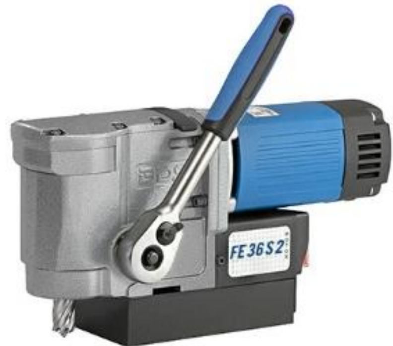
FE 36 S2

قدرت موتور: ۱۰۸۰ وات مته گردبر: قطر ۳۶ میلی‌متر کورس: ۳۹ میلی‌متر اسپیندل: دنباله ولدان ۱۹۰۰۵ میلی‌متر سرعت: ۴۰۰ دور در دقیقه ابعاد مگنت: ۸۰ * ۱۶۰ * ۳۶.۵ میلی‌متر قدرت مگنت: ۹۷۵۰ نیوتن ارتفاع: ۱۸۰ میلی‌متر وزن کل: ۱۱ کیلوگرم