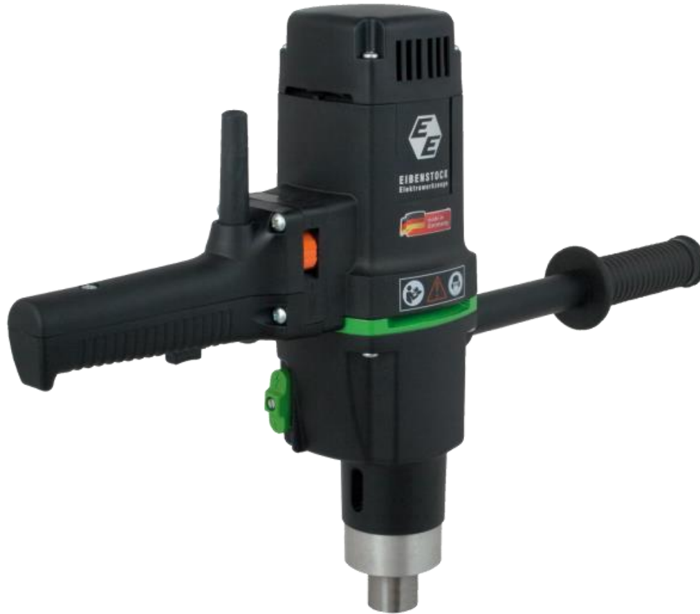
EHB 322.2 R RL