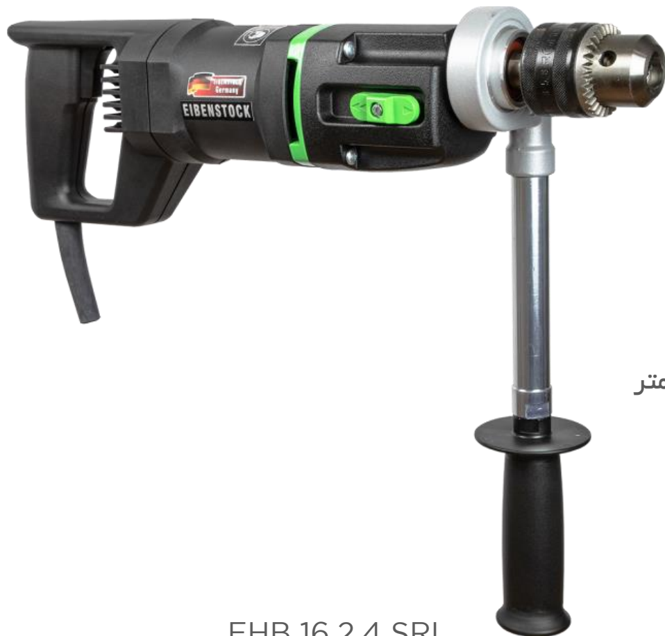
EHB 16.2.4 SRL