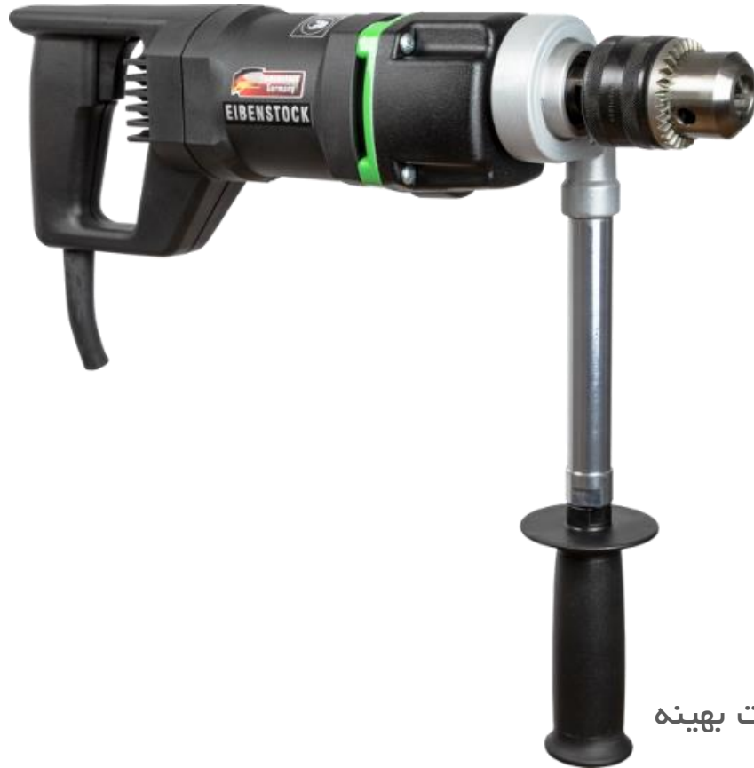
EHB 16.1.4 SRL